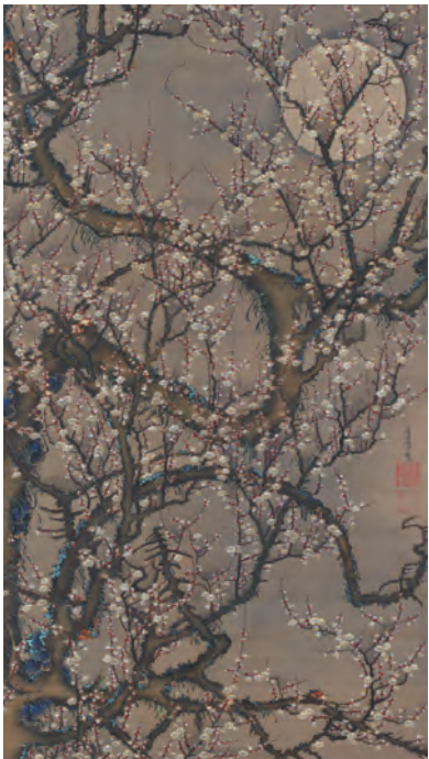
8 梅花皓月図(ばいかこうげつず)