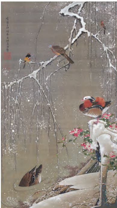
3 雪中鴛鴦図(せっちゅうえんおうず)