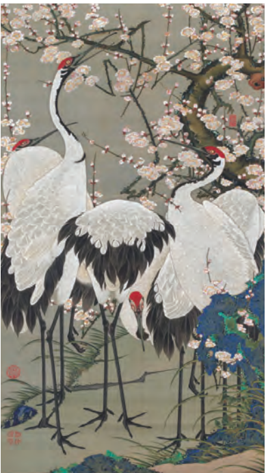
15 梅花群鶴図 (ばいかぐんかくず)