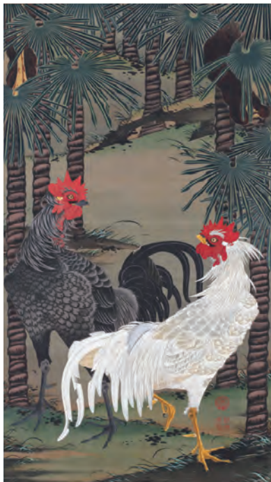
16 棕櫚雄鶏図(しゅろゆうけいず)