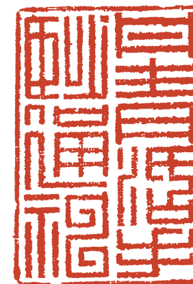
朱文長方印「丹青活手妙通神」 (池辺群虫図より)