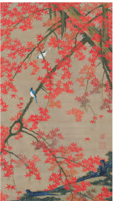
30 紅葉小禽図 (こうようしょうきんず)