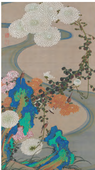
29 菊花流水図 (きっかりゅうすいず)