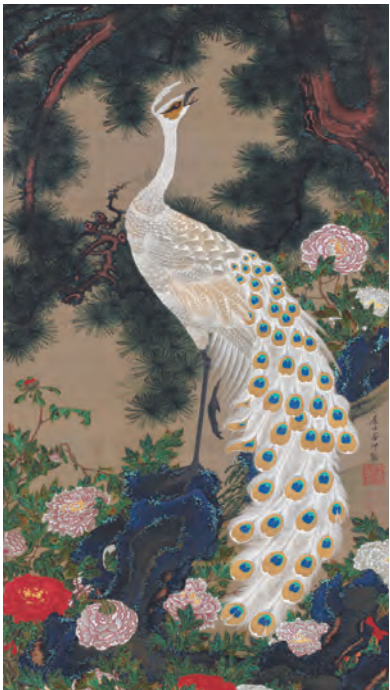
9 老松孔雀図(ろうしょうくじゃくず)