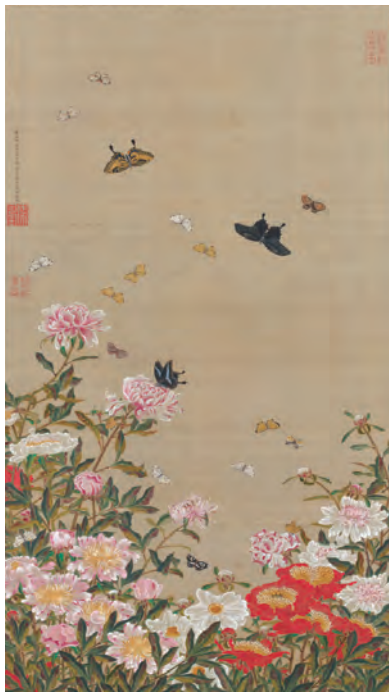
1 芍薬群蝶図(しゃくやくぐんちようず)

伊藤若冲(1716~1800) 江戸時代(18世紀) 絹本着色、全30幅 皇居三の丸尚蔵館収蔵 各縦141.8~143.4×横78.9~80.1cm