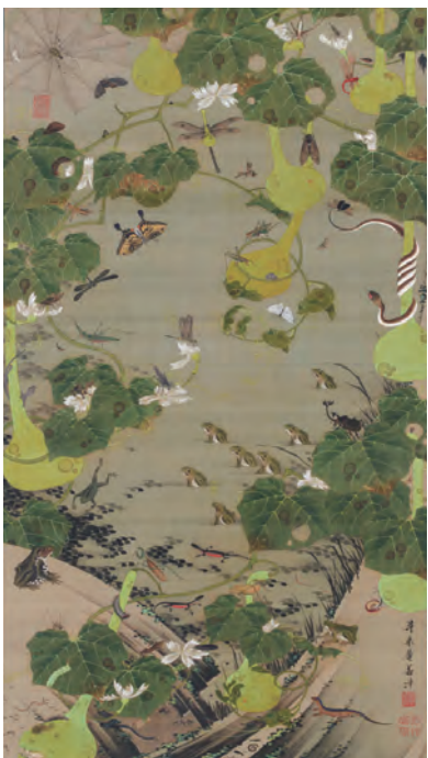
23 池辺群虫図(ちへんぐんちゅうず)