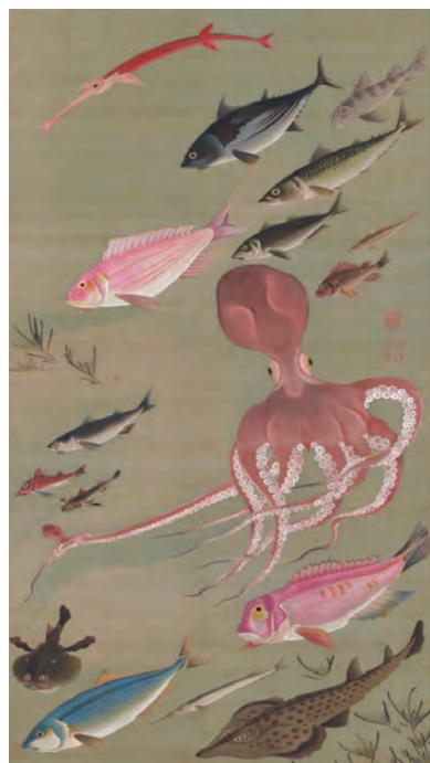
27 諸魚図 (しよぎょず)