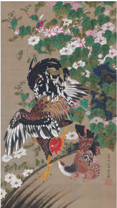
10 芙蓉双鶏図(ふようそうけいず)