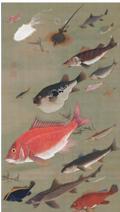
28 群魚図 (ぐんぎょず)