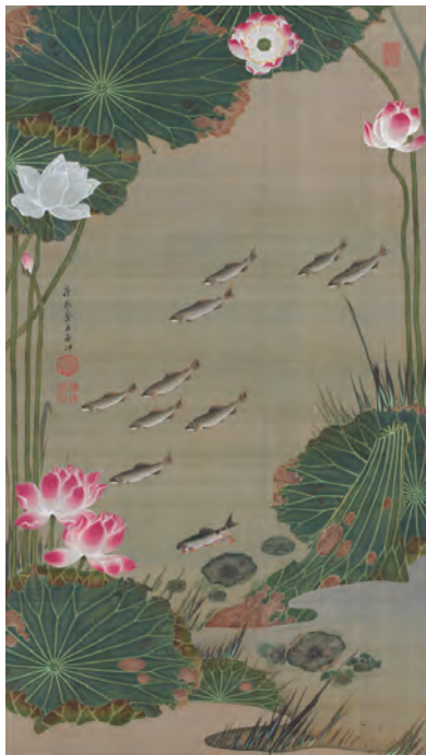
17 蓮池遊魚図(れんちゆうぎよず)