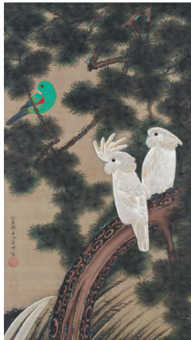
12 老松鸚鵡図 (ろうしょうおうむす)