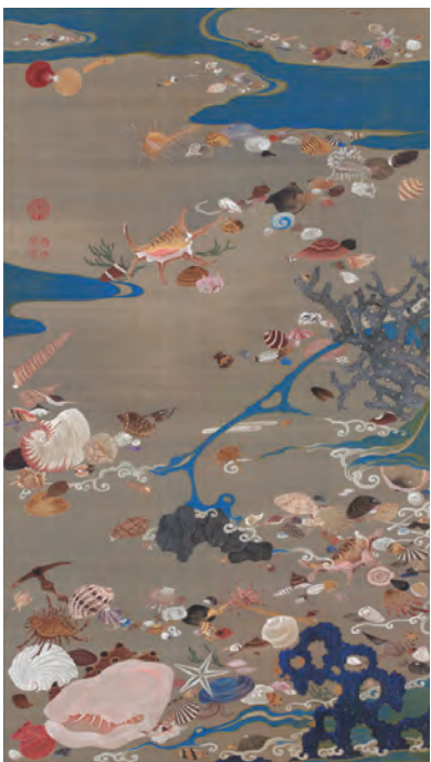
24 貝甲図(ばいこうず)