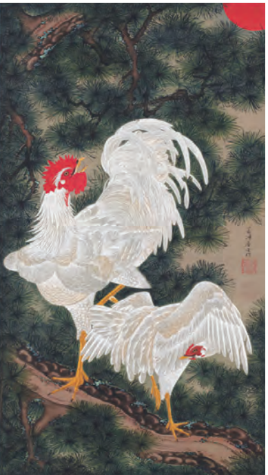
11 老松白鶏図(ろうしょうはつけいず)