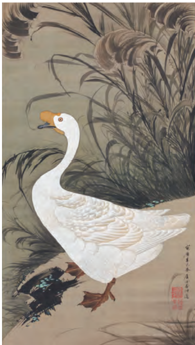
13 芦鶩図 (ろがず)