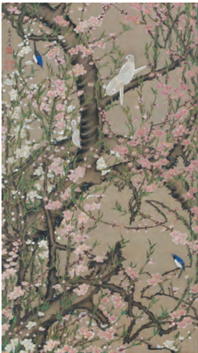
18 桃花小禽図(とうかしょうきんず)