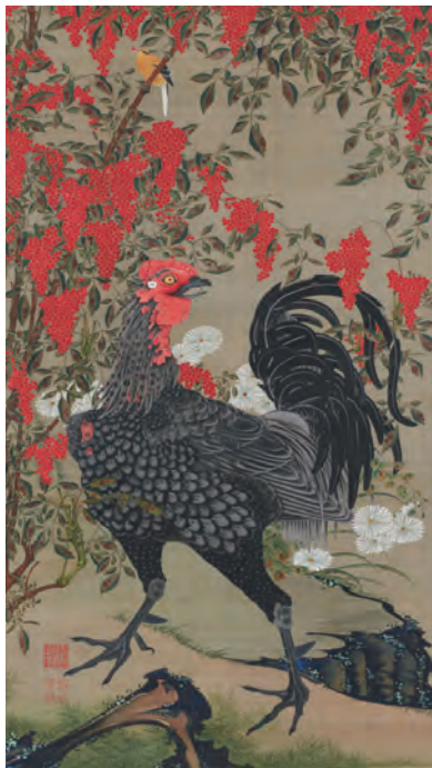
14 南天雄鶏図 (なんてんゆうけいず)