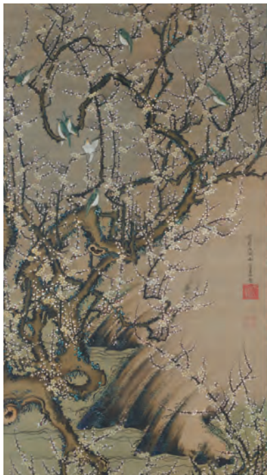
2 梅花小禽図(ばいかしょうきんず)