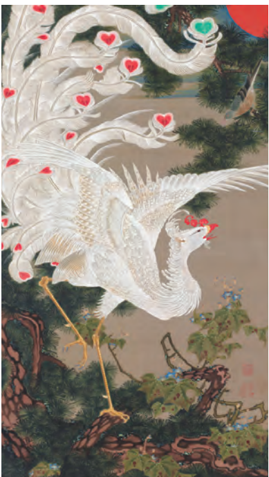
25 老松白鳳図(ろうしょうはくほうず)