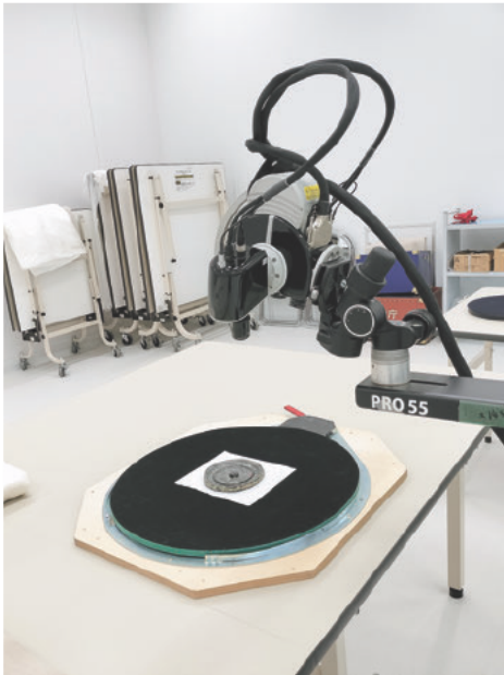
図1 三次元計測状況