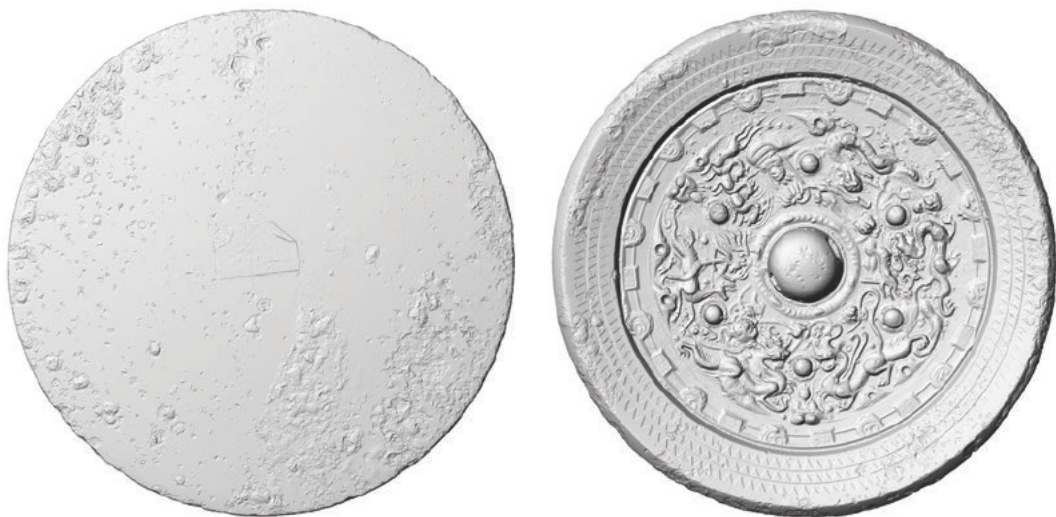
図3 飛禽走獣文鏡 (SZK000360) の三次元計測画像