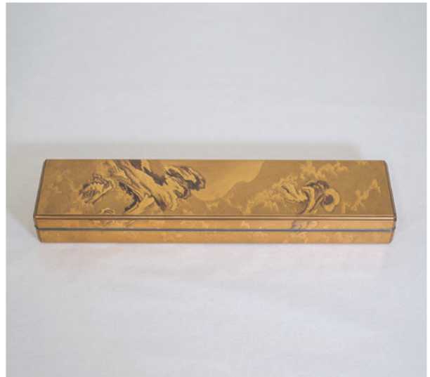
図1b 短冊箱 修理前