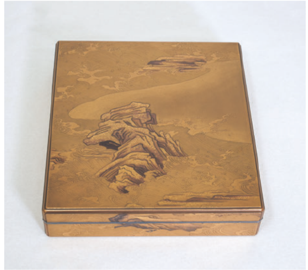
図1a 色紙箱 修理前