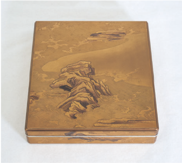
図1a 色紙箱 修理後