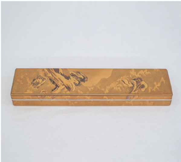
図1b 短冊箱 修理後