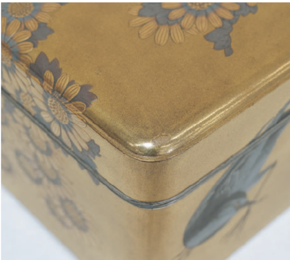
図8 蒔絵塗膜の剝離部 (修理後)