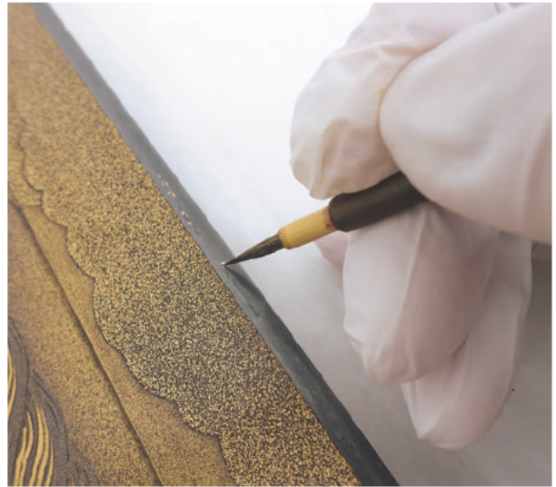
図6 縁の被せ銀 錆剥落止め