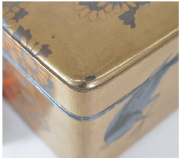
図8 蒔絵塗膜の剝離部 (修理前)