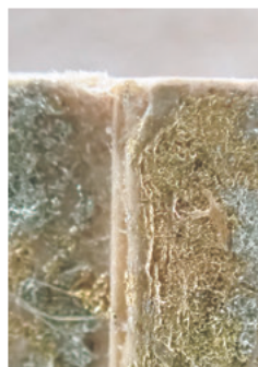
図3 料紙の積層構造