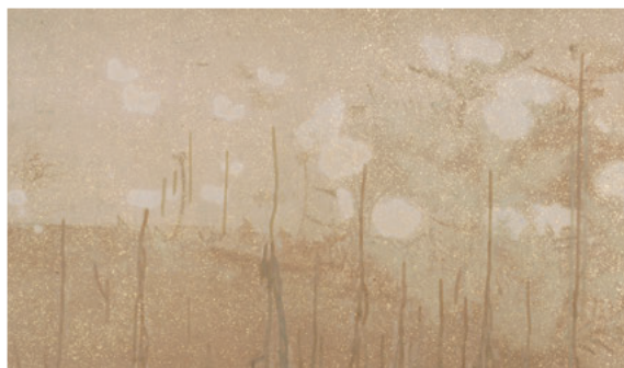
図2 料紙の変色と補強の様子