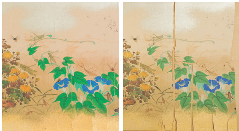
図1 料紙の亀裂と断裂（右は修理前、左は修理後）