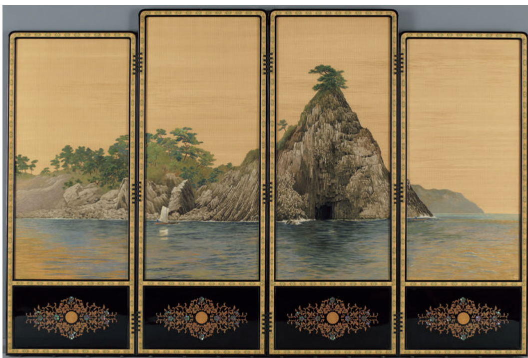
图1 《博多織四枚折屏風》前面 当館収蔵