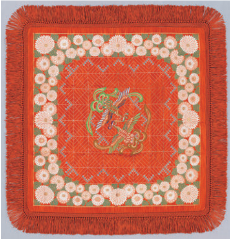
図6 《博多織卓子掛》 当館収蔵