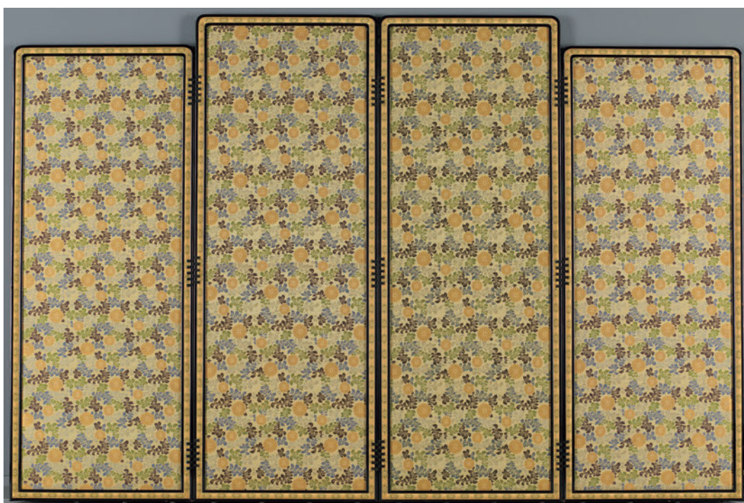
图2 《博多織四枚折屏風》背面 当館収蔵