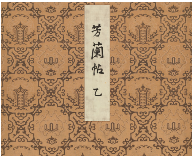
図1 伊藤博文書簡が収められた乙巻の表紙

丁・戊の全五帖から成り、装丁は折本装、表紙と裏表紙は蜀江文風の綾裂、寸法は縦四四・〇、横五四・五、厚二・三、三・二（cm）、各帖の表紙中央に貼付された絹地の題箋に「芳蘭帖」及び「甲」から「戊」がそれぞれ墨書され、仕立ては全帖に共通する【図1】。