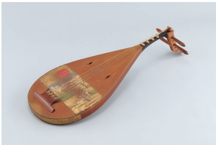
図2 琵琶《旭》 皇居三の丸尚蔵館収蔵

けて各大名家や堂上家からの楽器の献上が相次いだ。その後も天皇の晩年に至るまで各所より楽器の献上が続き、天皇自身による楽器蒐集も行われていた様子資料『楽器御目録』から判明する。嘉永七年の御所炎上後に天皇のもとに集められた楽器が、【表1】にみる「御物」楽器群の中心を構成しているのである。